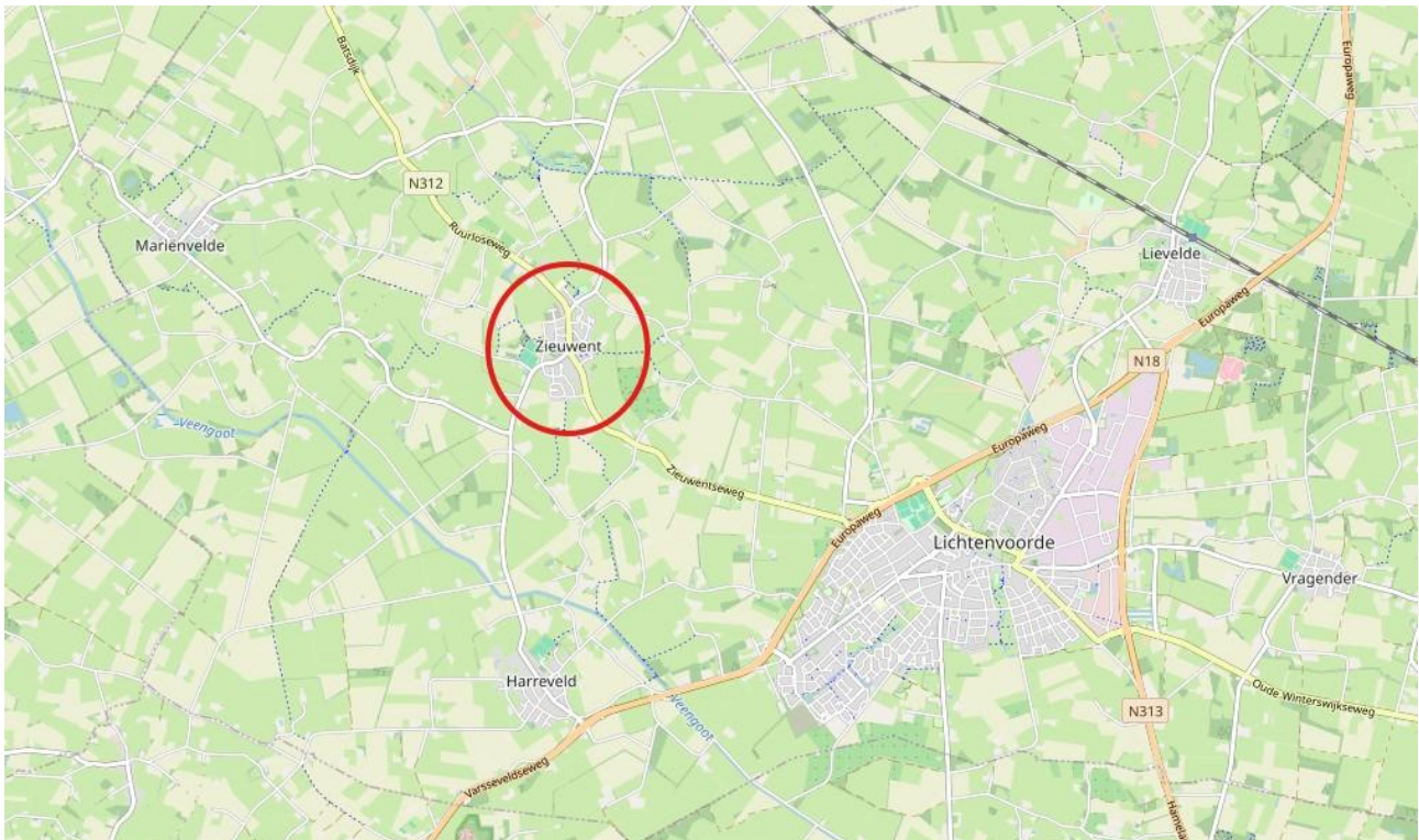
Figuur 1 Situatie gemeente.

De gemeente is voornemens een deel van de kern van Zieuwent te reconstrueren en her in te richten.