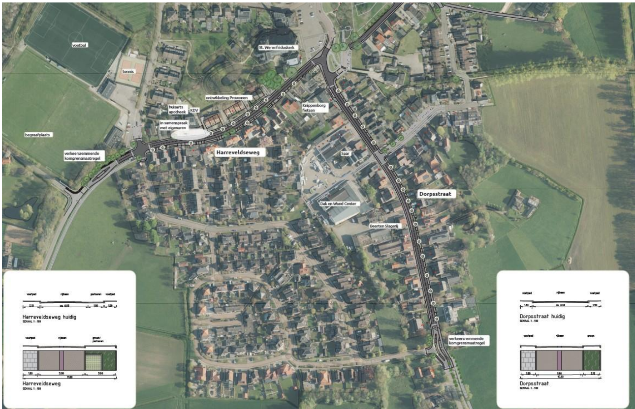
Figuur 2 Weergave projectgebied.

Het ontwerp proces is samen met het dorp Zieuwent doorlopen. De technische afronding van het ontwerp proces behoort tot deze opdracht. Van de aannemer wordt verwacht dat zij de uitvoering verzorgt en daarnaast proactief meedenkt om samen met de gemeente Oost Gelre en de regiegroep Zieuwent de laatste details uit te werken en de maakbaarheid te waarborgen. De gemeente heeft Anacon-Infra ingehuurd om in haar deel van de taken te ondersteunen en de technische uitwerking te verzorgen.